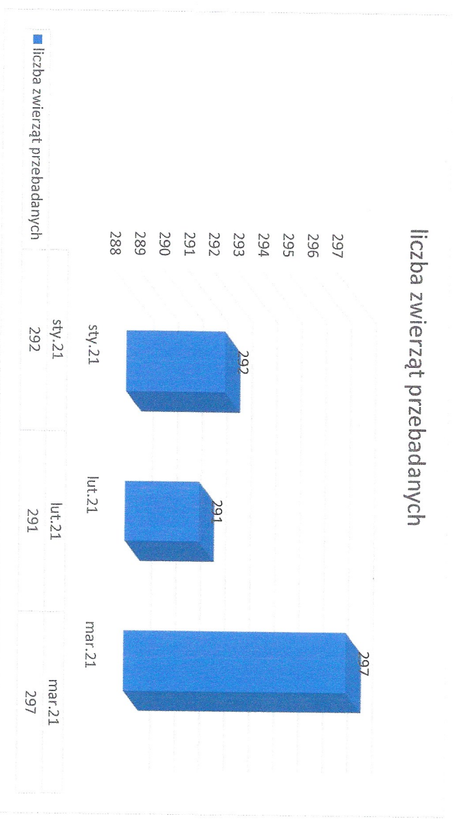
liczba zwierząt przebadanych